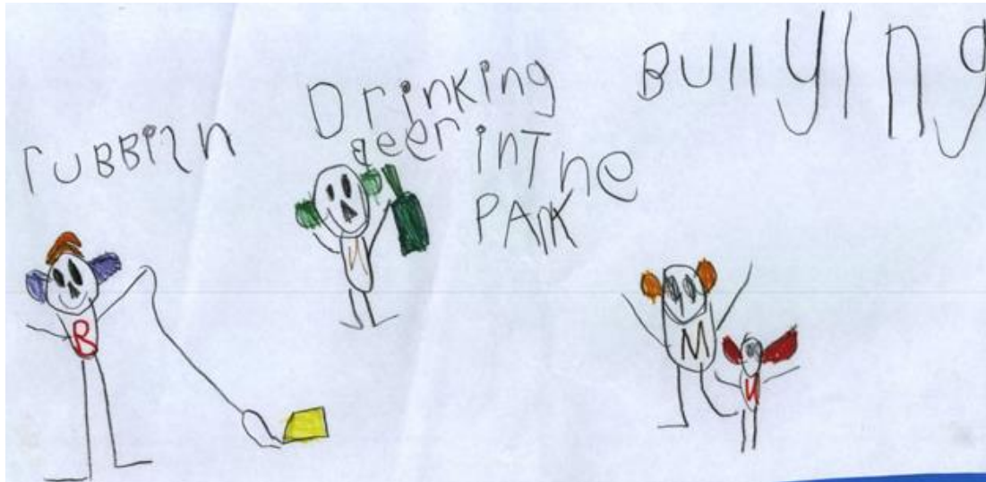
სურათი 2: 7 წლის ბიჭი (წარწერები ნახატზე: ნაგავი, პარკში ლუდის დაღვევა, ბულინგი)

ჩემი სახლის გარეთ მინდორია. მე და სხვა ბიჭები, რომლებიც ახლოს ცხოვრობენ, იქ ყოველთვის ფეხბურთს ვთამაშობთ. მაგრამ, იქ ერთი კაცია, რომელიც გვეუბნება რომ ბაღახუე არ ვითამაშოთ ან ქუჩის მიმდებარედ ვითამაშოთ, სადაც მოძრაობა გადატვირთულია და ბურთი ხშირად ქუჩაზე ვარდება (11 წლის ბიჭი).