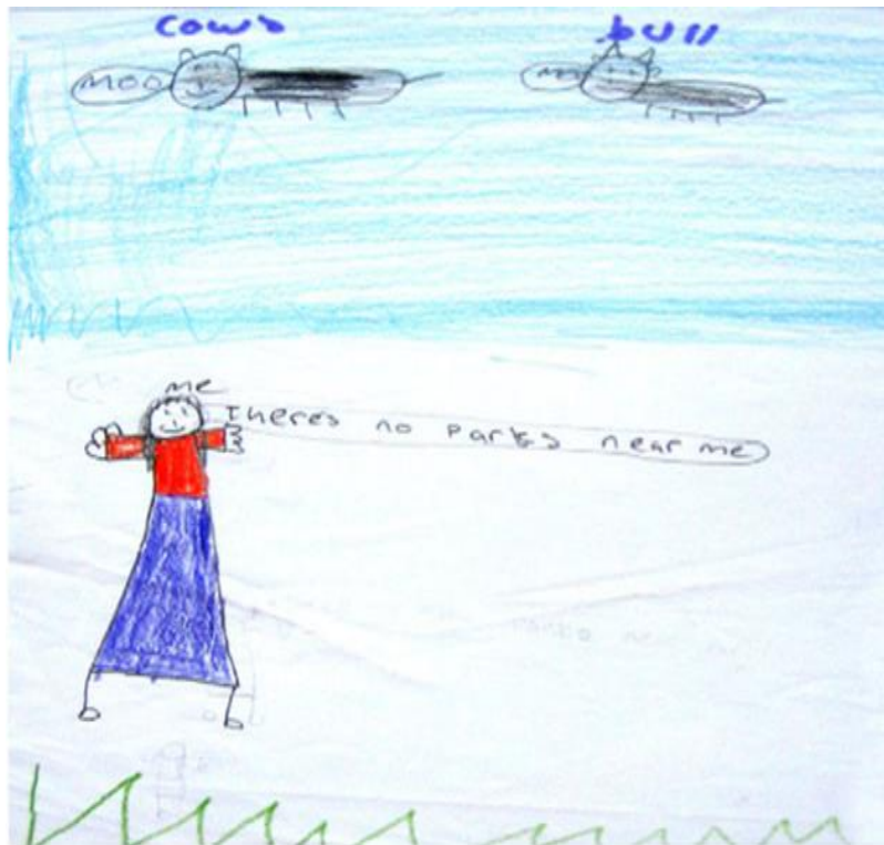
სურათი 1: 8 წლის გოგონა (წარწერა ნახატზე: ირგვლივ პარკები არ არის)