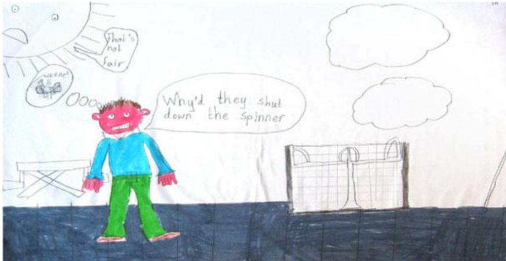
სურათი 4: 11 წლის ბიჭუნა (წარწერა სურთაზე: რატომ დახურეს “სპინერი”; ეს უსამართლობაა)

მე-12 მუხლის თანახმად, ყველა ბავშვს აქვს უფლება გამოხატოს საკუთარი შეხედულება ბავშვთან დაკავშირებულ ყველა საკითხზე ან პროცედურაზე, რომელიც ზეგავლენას ახდენს ბავშვზე, ამასთან ბავშვის შეხედულებებს სათანადო ყურადღება ეთმობა ბავშვის ასაკისა და მოწიფულობის შესაბამისად.