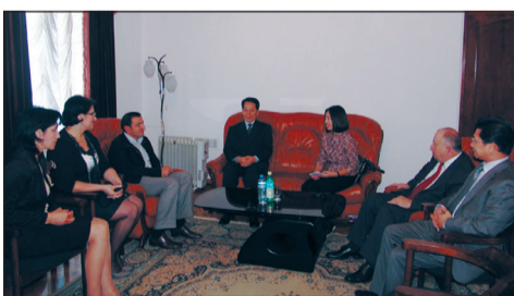
სახელმწიფო ანსამბლ „ხორუმისა“ და მ. კუხიანიძის სახელობის სახელმწიფო გუნდის კონცერტით დასრულდა.