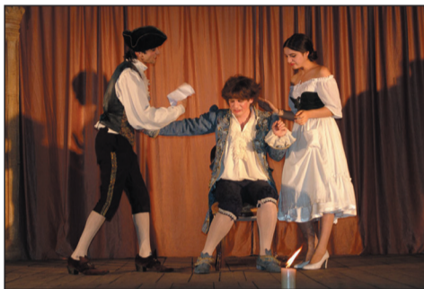
„ზაფხულის ღია ახალგაზრდული თეატრის“ რამდენიმე თვის განმავლობაში ქალაქის ბულვარსა და ქუჩებში არაერთი სპექტაკლი დადგა.

უნივერსიტეტის ეზოში სტუდენტური თვითმმართველობის ინიციატივით იტალიელი კომედიოგრაფის კარლო გოლდონის „სასიერო ოინის“ ჩვენება გაიმართა. რეჟისორ ოთარ ქათამაძის სპექტაკლში პროფესიონალ მსახიობებთან ერთად სხვადასხვა ფაკულტეტის სტუდენტებიც მონაწილეობდნენ. „Comedia del arte“-ს სტილში დადგმული წარმოდგენა ქალაქ ბათუმის მერიის ახალგაზრდობის საქმეთა მუნიციპალური პროგრამის ფარგლებში შედგა, რომლის მიზანია ნიჭიერი, შემოქმედებითი უნარის მქონე ახალგაზრდების მხარდაჭერა და მათი წარმოჩენა.